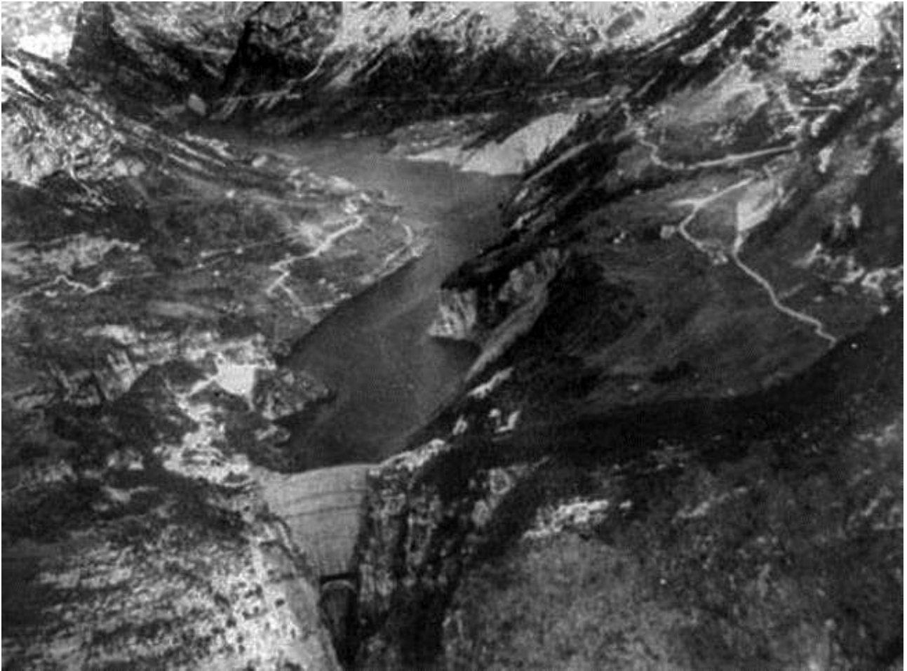
Foto aerea del Vajont, della diga, degli impianti annessi, del suo bacino artificiale, prima della tragedia.

Sulla sponda destra della valle (sinistra per chi guarda) si vedono i Paesi rivieraschi: