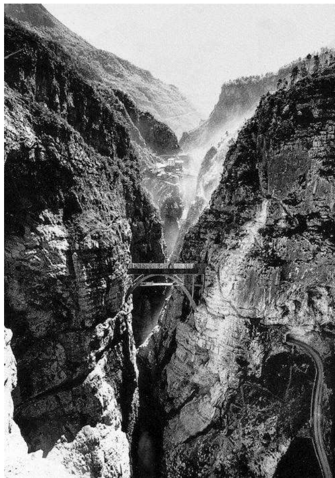
Gola del torrente Vajont prima della costruzione della diga

oltre duemila tra morti e dispersi; una grande tragedia coloniale; lezione da non dimenticare mai!