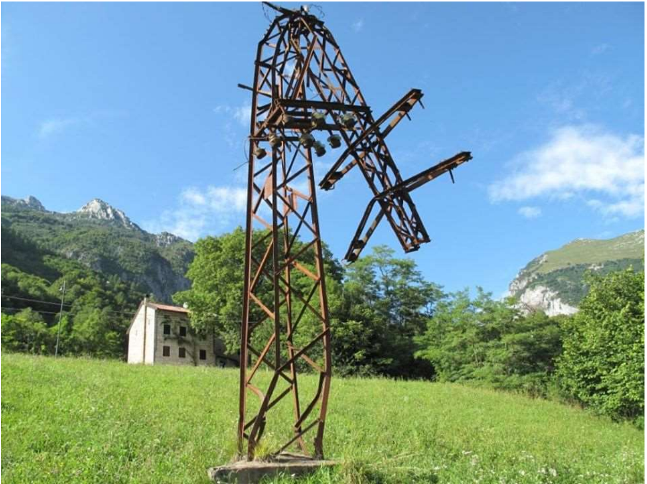
Erto e Casso, sponda destra della Valle del Torrente Vajont, traliccio elettrico deformato dall'ondata